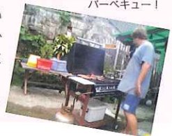
ホスト宅の庭でのバーベキュー！